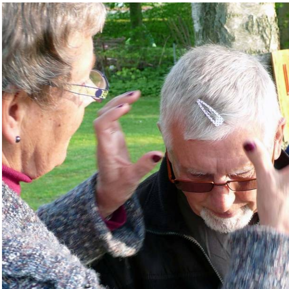
Vor fotograf har fanget det øjeblik, hvor Græshyleren underkaster sig heksedoktoren. Borebiller ses tydeligt over frontallappen.

Med eneret for NYHEDSBREVET kan vi afsløre, hvordan det lykkedes Græshyleren og Den Håndgangne at slå så kompetente spillere som Missilet og Løven med 13 -11.