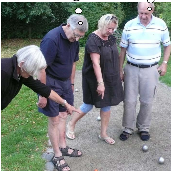
Petanque kan sagtens bringe sindene i kog. Her diskuteres et par kvinder højlydt deres kuglers lidt ubehjælpelige placering, mens mændene har helt anderledes alvorlige ting at tænke på.

Flere læsere har spurgt hvad det dog er Målerlarven har mellem benene på billedet i sidste udgave af NYHEDSBREVET. Vi har undersøgt sagen og kan meddele d'herre, at det er en petanquekugle, der netop er kastet.