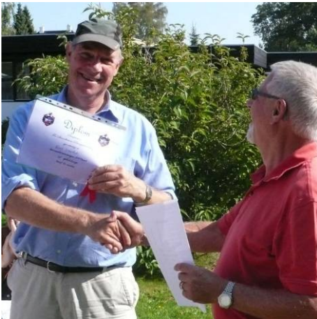
Præsidenten overrækker diplom og et par flasker til Jægeren, der var vældig tilfreds med sin egen præstation

Sangen har gjaldet fra et bestemt hus i Strandhaven hele den forløbne uge. Champagnepropperne sprang og stemningen var euforisk – i det hus! Men det var bestemt velfortjent og helt uden diskussion, at Jægeren kunne modtage diplom og hyldest fra medspillerne samt en enkelt æresgæst.