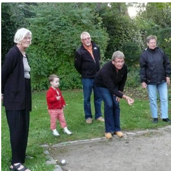
En af de nye spillere i juniorrækken betragter kritisk et skruet kast fra Miss-i-let's hånd.

"Det højner jo ikke kvaliteten, for ikke at sige vitaliteten, i spillet" siger en anonym talsmand for Præsidenten. "Så derfor har vi iværksat en hvervekampagne blandt de unge. Det ser ud til at bære frugt"