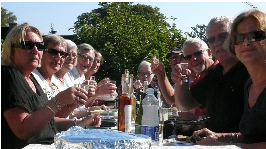
Spillerne i et ubevogtet øjeblik under afslutningsfrokosten. For de fleste spillere er det naturligt at stikke næsen lidt for langt frem, før den bliver dypet